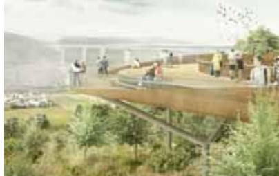
Moselblick Trier

Die Entwürfe des 2011 von René Rheims in Krefeld gegründeten interdisziplinär arbeitenden Landschaftsarchitektur und Stadtentwicklungsbüros, zeichnen sich durch sehr klare, oft plakative und pragmatische Ideen aus. Sie machen mit demonstrativen, aber sachlichen Entwürfen auf sich aufmerksam, und der Chef baut auch schon Mal Modelle aus Obst und Schokolade: Das 13-köpfige Team scheut sich nicht vor unorthodoxen Methoden.