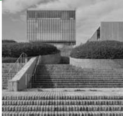
Nishida Kitarô Museum

In seinem Vortrag stellt der in Freiburg lebende Philosoph Prof. Dr. Günter Figal seine wichtigsten Überlegungen seines vor Kurzem erschienenen Buches vor: „Ando – Raum Architektur Moderne“. Er versucht zu klären, warum sich ein Philosoph für Architektur interessieren kann (und interessieren sollte), und welche Fragen sich im Zusammenhang eines solchen Interesses ergeben (können).