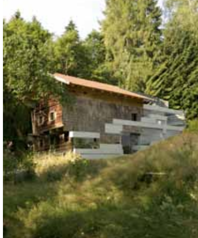
Schedberg © Peter Haimerl. Architektur

In Kooperation mit | Ensemblehaus Freiburg Mit Unterstützung von | InformationsZentrum Beton | Becherer | Alsecco | Lithodecor