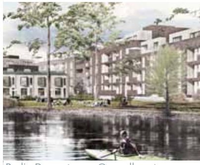
Berlin Daumstrasse © vandkunsten

In Kooperation mit | Kunstraum Alexander Bürkle