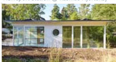
Movable House © WEISSWERT | Basel