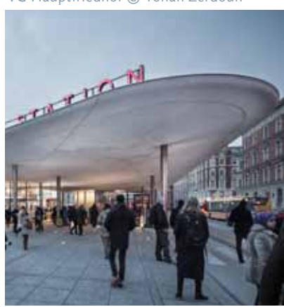
Nørreport Station